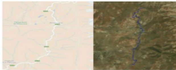
Figura 1. Localización del trazado

Segundo. - La prueba tendrá lugar por el tramo asfaltado comprendido entre el Mirador de Morro Velosa y la Vega de Río Palma, que discurre en su totalidad por la carretera FV-30, dentro del municipio de Betancuria. El emplazamiento de la salida está fuera de núcleos urbanos, pero existe un tramo que atraviesa el casco de Betancuria.