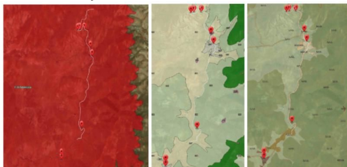
Figura 6. Trazado de la prueba automovilística y localización de zonas acotadas de público, parque de vehículos, aparcamiento público de vehículos, servicios higiénicos y zona de recogida selectiva de residuos de los dentro del Parque Rural de Betancuria

Tercero. - El evento transcurre dentro del Parque Rural de Betancuria que dispone de Plan de Uso y Gestión, aprobado definitivamente por Acuerdo de la Comisión de Ordenación del Territorio y Medio Ambiente de Canarias de fecha 26 de marzo de 2009 (BOC Nº093, lunes 18 de mayo de 2009).