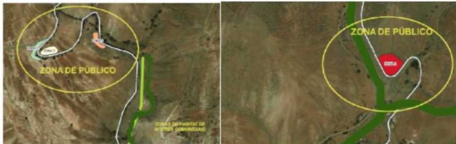
Figura 2. Localización de las zonas de público (zona 1,2,3 y 4)

- Zonas 2,3 y 4, aproximadamente en el kilómetro 14 de la FV-30, coordenadas: X:591.726 Y: 3.145.629.