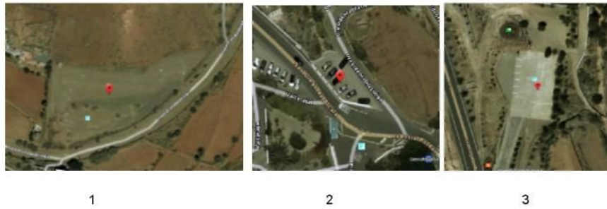
Figura 4. Localización de las zonas de aparcamiento público: 1 Barranco de Río Palma; 2 zona de la Iglesia de Betancuria; 3 Convento de San Buenaventura

Tercero. - La fecha prevista para la realización de la actividad es el 16 de julio de 2022, entre las 9:00 y las 17:00 horas. Se prevé que la carrera durará 4 horas y a estas se le suma la duración de los entrenamientos.