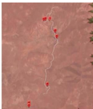
Figura 8. Trazado de la prueba automovilística y localización de zonas acotadas de público, parque de vehículos, aparcamiento público de vehículos, servicios higiénicos y zona de recogida selectiva de residuos de los dentro de la ZEPA Betancuria.

De conformidad con lo dispuesto en el artículo 44 de la Ley de Biodiversidad, serán declarados como ZEPAs, los espacios del territorio nacional y del medio marino, junto con la zona económica exclusiva y la plataforma continental, más adecuados en número y en superficie para la conservación de las especies de aves incluidas en el anexo IV de esta ley y para las aves migratorias de presencia regular en España, y se establecerán en ellas medidas para evitar las perturbaciones y de conservación especiales en cuanto a su hábitat, para garantizar su supervivencia y reproducción. Para el caso de las especies de carácter migratorio que lleguen regularmente al territorio español y a las aguas marinas sometidas a soberanía o jurisdicción española, se tendrán en cuenta las necesidades de protección de sus áreas de reproducción, alimentación, muda, invernada y zonas de descanso, atribuyendo particular importancia a las zonas húmedas y muy especialmente a las de importancia internacional.