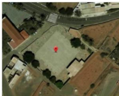
Figura 3. Localización de los servicios higiénicos

Existe una zona para ubicar los servicios higiénicos: Plaza de Río Palma, coordenadas 28.392845, -14.071093