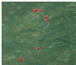
Figura 10. Trazado de la prueba automovilística y localización de zonas acotadas de público, parque de vehículos, aparcamiento público de vehículos, servicios higiénicos y zona de recogida selectiva de residuos de los dentro de la Reserva de La Biosfera de Fuerteventura.

Sexto. - La isla de Fuerteventura y su mar circundante fueron declarados Reserva de la Biosfera (BOE nº27 de 1 de febrero de 2010), estableciéndose su zonificación (Zona Núcleo de mayor protección, Zona Tampón de amortiguación de las actividades humanas compatibles y Zona de Transición). La actuación se encuentra en Zona de Tampón.