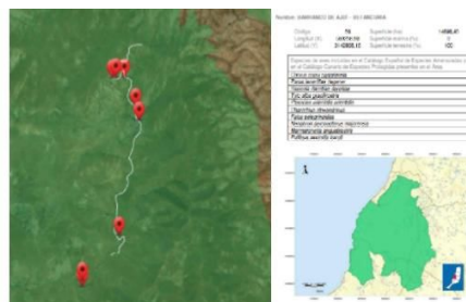
Figura 11. Trazado de la prueba automovilística y localización de zonas acotadas de público, parque de vehículos, aparcamiento público de vehículos, servicios higiénicos y zona de recogida selectiva de residuos de

Séptimo. - Áreas prioritarias de reproducción, alimentación, dispersión y concentración de las especies amenazadas de la avifauna de Canarias. Área número 56, "Barranco de Ajuí - Betancuria".